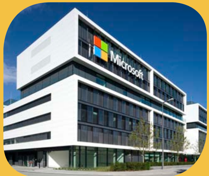
Pilkington Suncool ™ 66/33 Unternehmenszentrale Microsoft Deutschland GmbH, München.