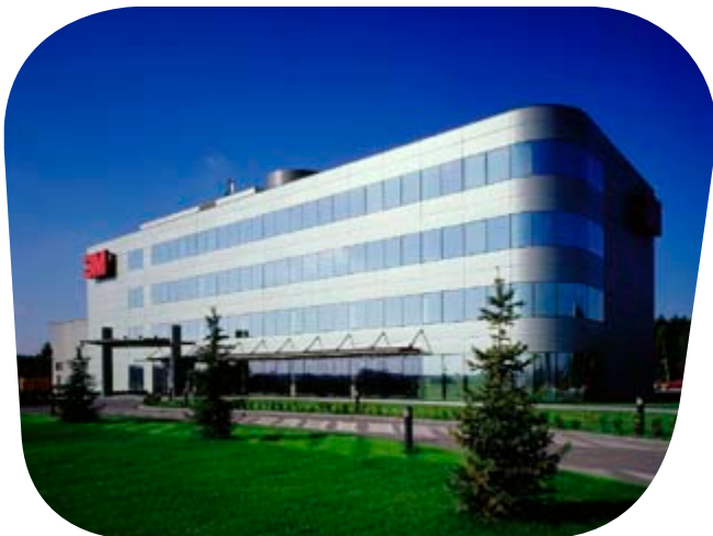
Pilkington Fassadenplatten, Pilkington Suncool ™ Silver 50/30 3M Bürogebäude, Nadarzyn, Polen.