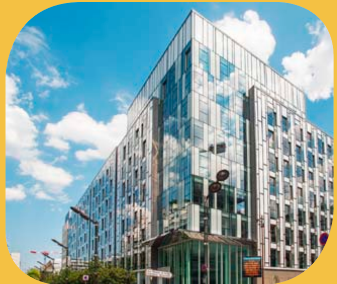
Pilkington Suncool ™ 70/40, Pilkington Suncool ™ 50/25 Le Malraux, Bürogebäude der HSBC Bank, Levallois Perret, Frankreich.