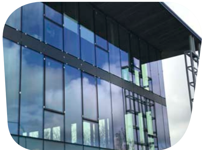
Pilkington Suncool ™ 70/35 T Bürogebäude in Castelfranco, Italien.