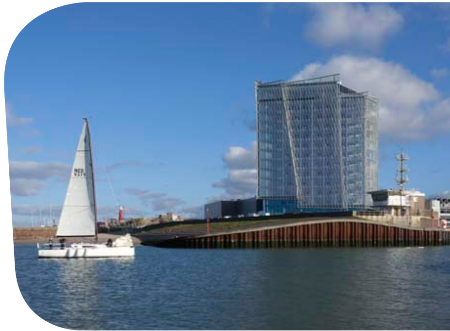
Pilkington Suncool™ 60/31 Pilkington DesignPrint.