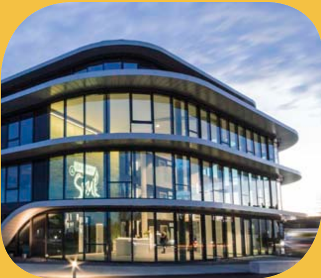
Pilkington Suncool ™ 50/25 Gastro & Soul GmbH, Hildesheim

© Uwe Lichnowski, Architekturbüro Lichnowski