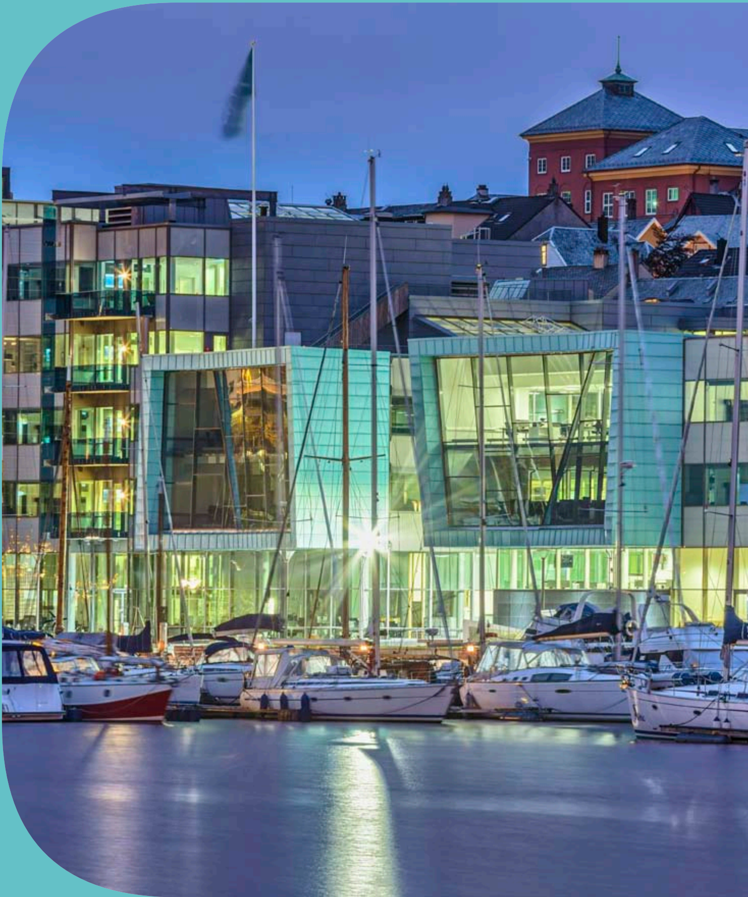
Pilkington Suncool ™ 70/35, Pilkington Suncool Optilam ™ 70/35 DNB Bürogebäude, Bergen, Norwegen.